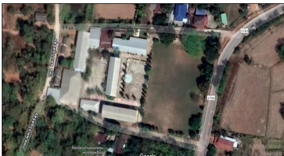
พื้นที่โรงเรียนบ้านแดงใหญ่ (ราษฎร์คุรุวิทยาคาร)

พื้นที่ทั้งหมด : 10 ไร่ 2 งาน 32.8 ตารางวา